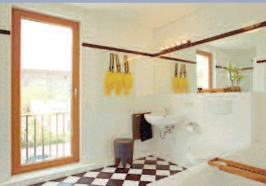
Das Fliesenmuster bildet den visuellen Schwerpunkt des Raumes und gibt ihm seinen ganz individuellen Charakter.